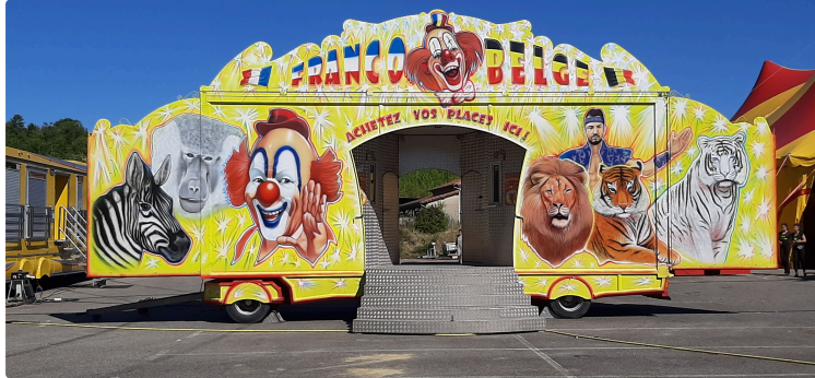
Le cirque franco-belge arrive à Vic !

La place du foirail va s'animer, dès lundi matin, avec l'arrivée des caravanes du cirque franco-belge et le montage du chapiteau.