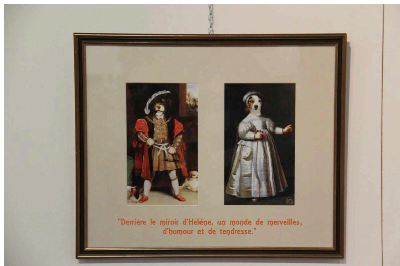
"Derrière le miroir d'Hélène, un monde de merveilles, d'humour et de tendresse."