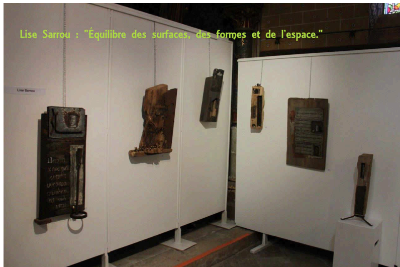
Lise Sarrou : "Équilibre des surfaces, des formes et de l'espace."