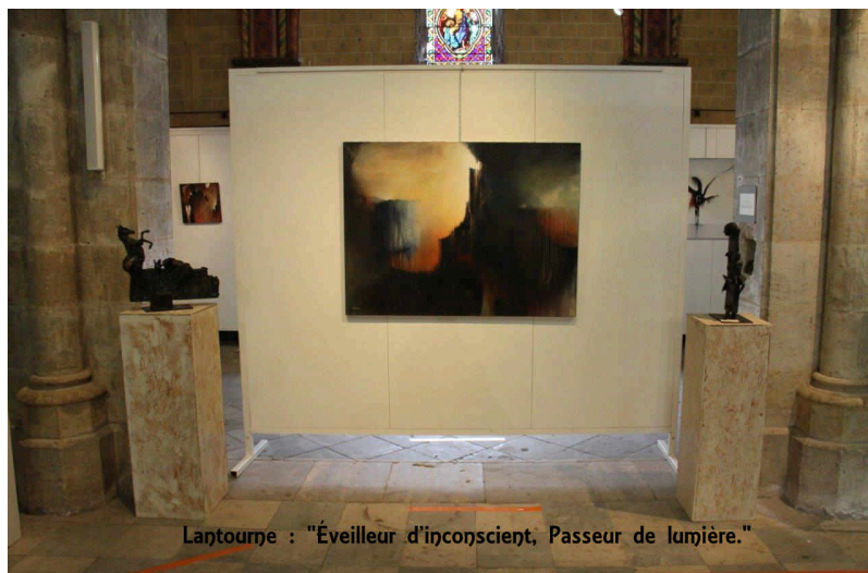
Lantourne : "Éveilleur d'inconscient, Passeur de lumière."