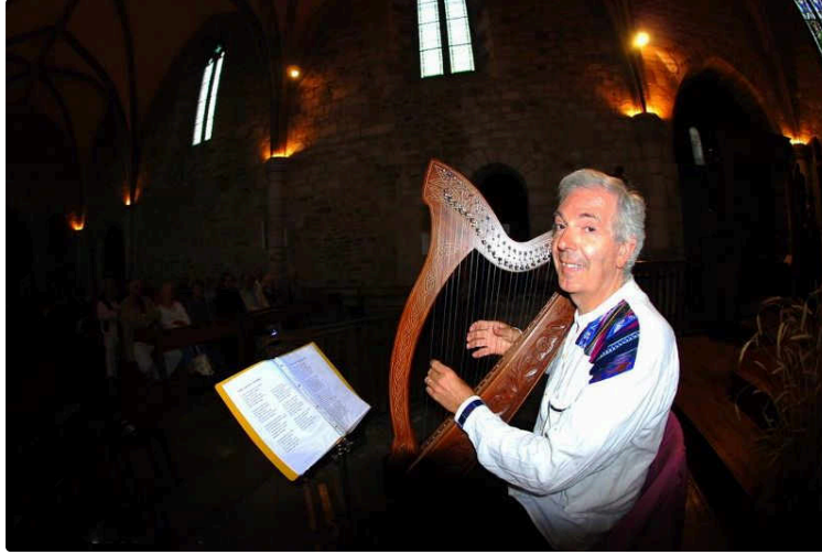
Une veillée comme au Moyen Âge

L'occasion de découvrir, en musique et en poème, l'histoire de Blanche de Castille