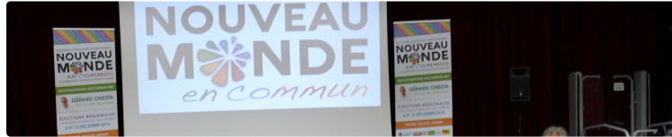
AUCH ELECTIONS REGIONALES Le parti,

C'est mardi 3 octobre en soirée dans la salle des Cordeliers d'Auch que le parti « Nouveau Monde, le rassemblement citoyen, écologique et solidaire » ouvrait sa campagne électorale dans le Gers pour les élections régionales qui se dérouleront les 6 et 13 décembre prochain.