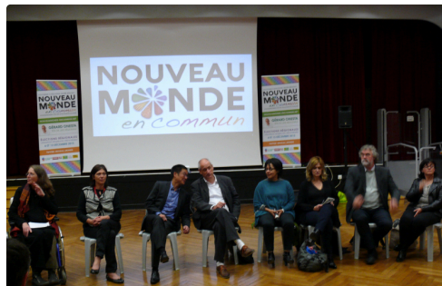
Les intervenants du "Nouveau Monde".