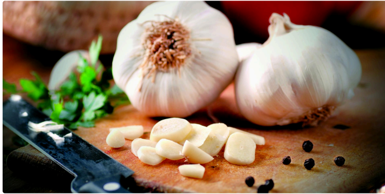
Les vertus insoupçonnées de l'Ail de Lomagne

Cultivé depuis 800 ans dans le Gers, il recèle des propriétés médicinales très vastes.