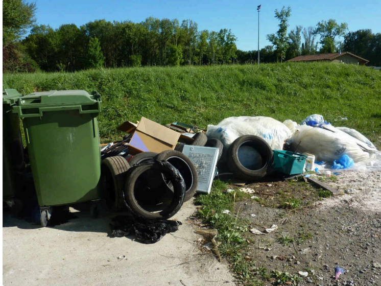
Des leçons de civisme seraient certainement nécessaires !

Attention, il est évident qu'il ne faut pas incriminer les seuls Paviens. N'importe qui pouvant être à l'origine de ces dépôts incongrus.