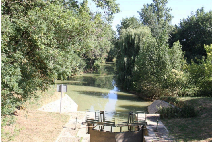
Relier Valence à Condom sans voiture, uniquement à la marche

Dorénavant, c'est possible. Une belle balade, au bord de la Baïse, en perspective !