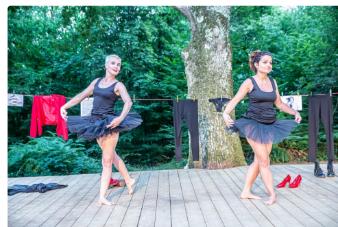
" Mauvaises graines" joué en 2019