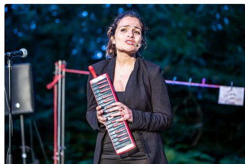
Stéphanie Magnus dans "Mauvaises graines"