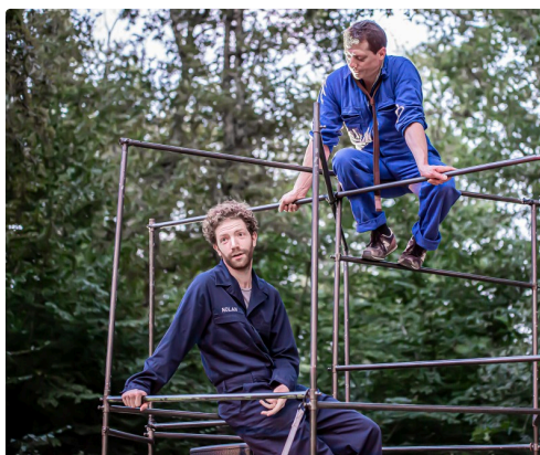
"Entre les lignes" joué en 2019