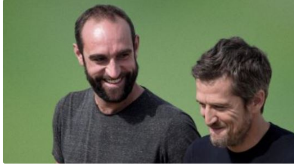
CultivonsNous.tv, le Netflix du monde agricole

Le but de CultivonsNous.tv est de rassembler urbain et ruraux autour des personnes qui nous nourrissent.