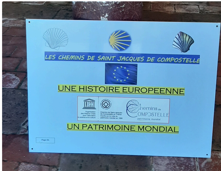
Rencontre avec Jean-Paul Amic

Auteur de l'exposition "Les chemins de St Jacques de Compostelle - Une histoire européenne - Un patrimoine mondial"