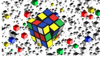
Jouons un peu

Mardi, c'est le 14 juillet. Commençons par un petit quizz entièrement consacré à la date du 14 juillet.