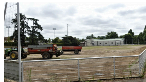
Stade Éric Carrière