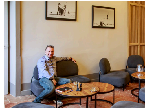
...sont servis les tapas des Bérets noirs