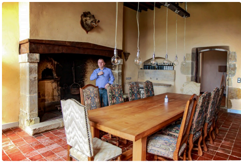
Salle-à-manger de caractère