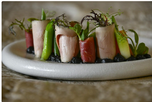
Foie gras (voir description détaillée dans l'article)