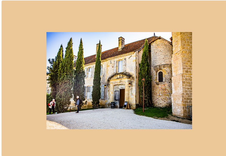
Retour à l'hôtel-restaurant du Monastère de Saint-Mont

Devenu en un an un haut lieu de la gastronomie et de l'art de vivre gascons