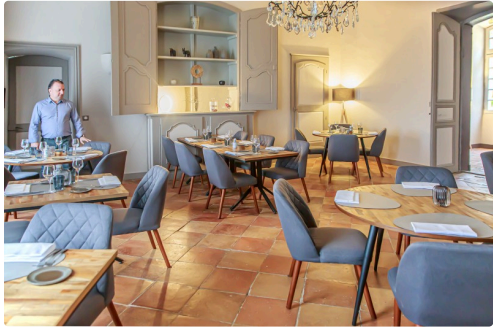
Salle-à-manger (à la belle saison, les repas ont lieu aussi dans la cour du Monastère)