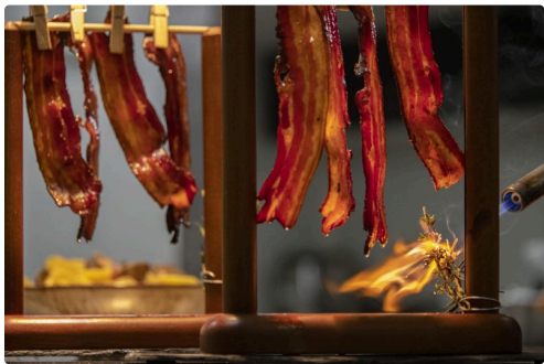
Poitrine de porc des Pyrénées (voir description détaillée dans l'article)