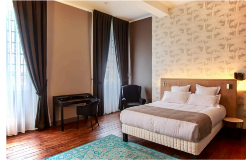
Exemple de chambre