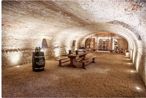
Cave de dégustation du Monastère