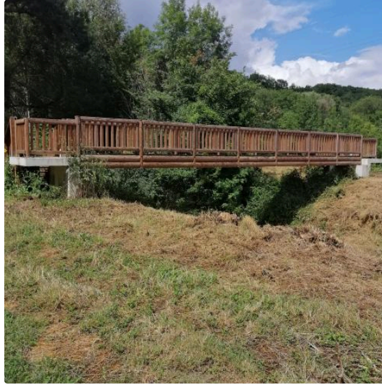
La balade de la semaine : le sentier pédagogique de la forêt domaniale Vic-Roquebrune (PR3)

Cette semaine, nous ne partons pas très loin de Vic puisque Cathy et Élodie nous font découvrir un sentier pédagogique récemment créé, le PR3 de la forêt domaniale Vic-Roquebrune .