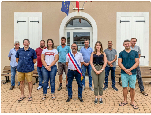
Le conseil municipal