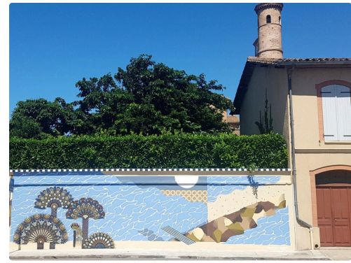
Fin de la fresque, ciel et couleur se confondent...que du bonheur, .bravo aux artistes !