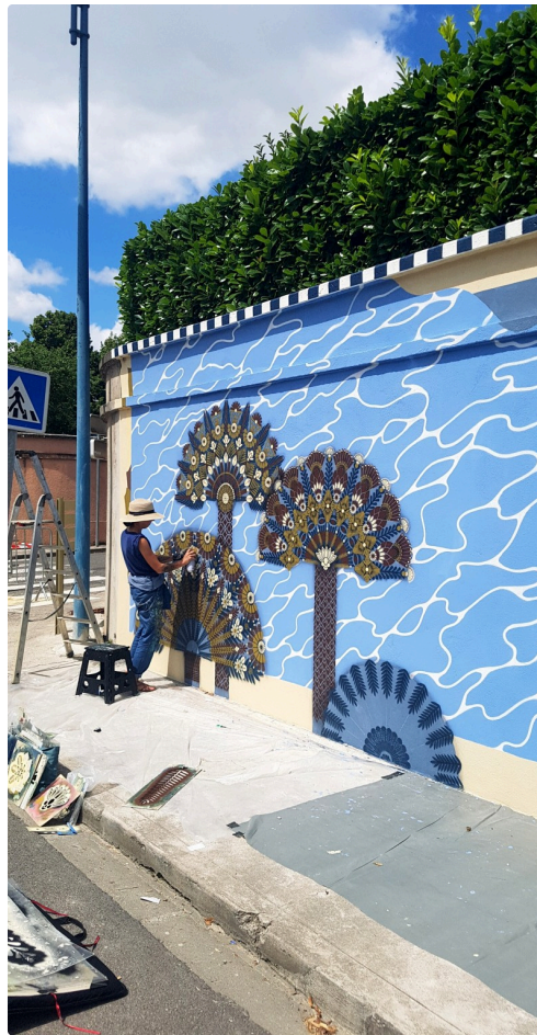
Des palmiers éventails superbes