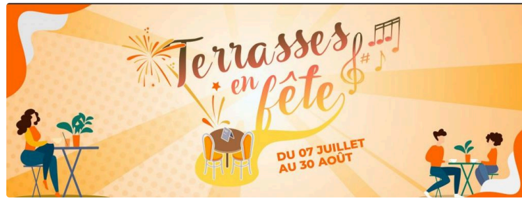
Les Terrasses en Fête

La Mairie de Mirande en partenariat avec l'Office Mirandais d'Animation met en place cette année le projet de TERRASSES EN FÊTE !!