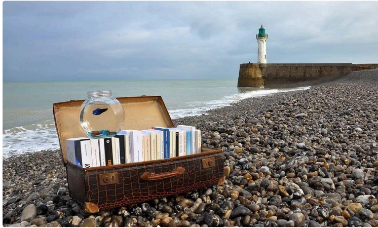
À vos marque-pages !

Chaque premier samedi du mois, le Journal du Gers vous propose une balade chez les libraires et vous révèle leurs coups de cœur du moment.