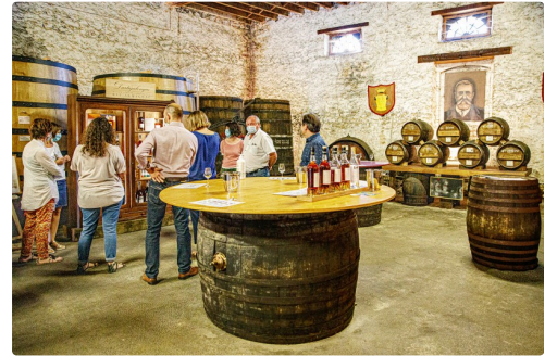
Salle de dégustation