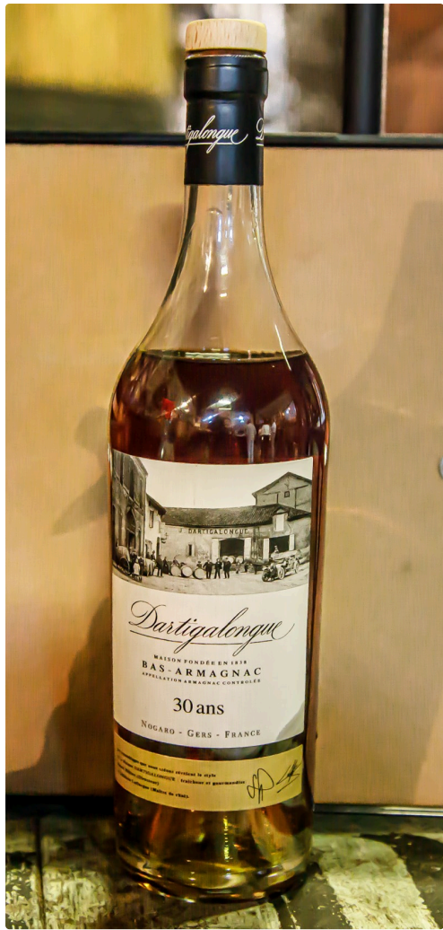
Un "must": le bas-armagnac 30 ans d'âge