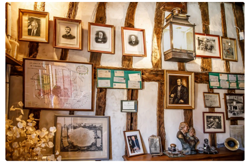
...où se trouve la galerie des ancêtres