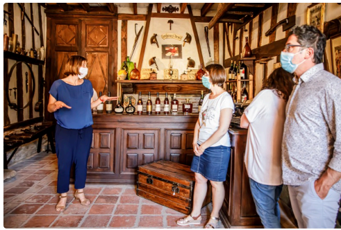
Local plein de trésors de famille...