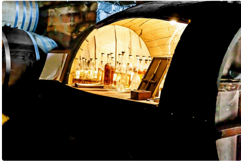
Petit trésor caché...