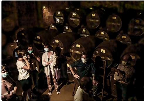
Les visiteurs dans le chai de vieillissement