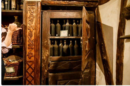
Encore des trésors