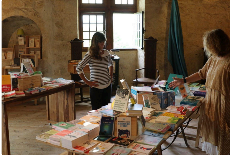
Une animation culturelle : exposition et nouvelle librairie

Un lieu d'exposition combiné à une librairie, situé dans l'enceinte du village de Larressingle, à côté de l'église, va ouvrir le 5 juillet 2020.