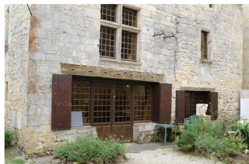
Retrouvez plus facilement le lieu de l'exposition en découvrant sa façade

Les quatre artistes ont confirmé qu'ils étaient partants pour réaliser l'édition 2021 sur les mêmes sites.