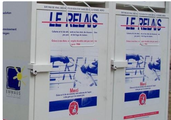
Pendant le confinement, vous avez trié vos placards !

Vous allez pouvoir recommencer à écouler vos textiles dans les bornes réservées à cet usage