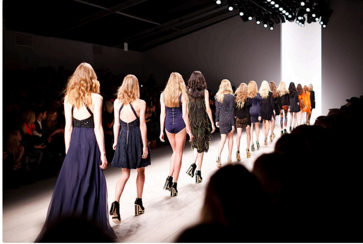
Allons-nous découvrir le prochain grand couturier ou un styliste de renom ?

... parmi les jeunes qui ne vont pas manquer de s'inscrire à un stage de création textile proposé par La Bobine