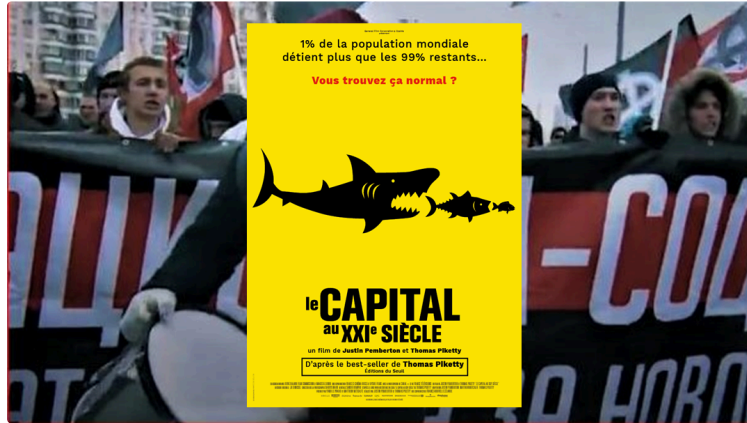
Le CAPITAL au XXIe SIECLE.