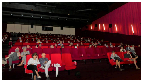
La salle affiche complet.