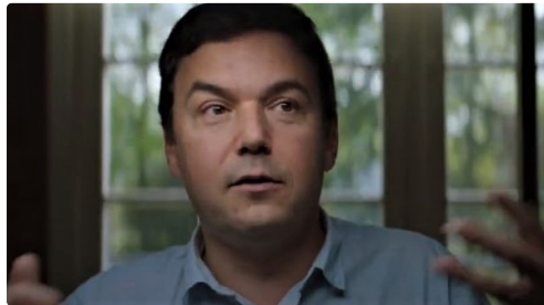
Thomas Piketty dans son film.

vendu à plus de 2.5 millions d'exemplaires.