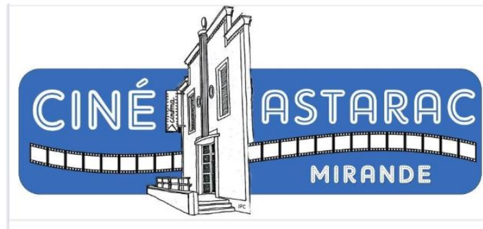
Le cinéma est de retour