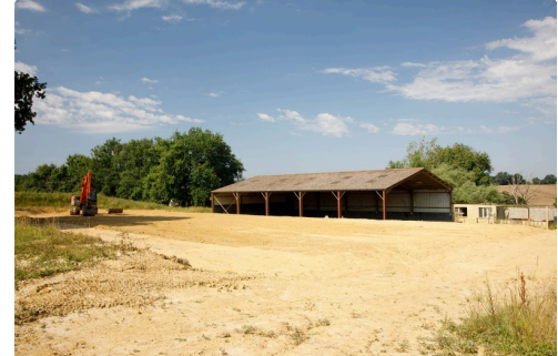
La carrière en construction avec le manège en arrière-plan