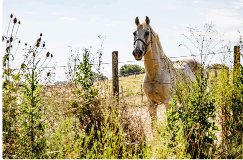
L'étalon Mariscal monté par Charlotte Cesi en compétition