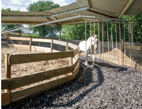
Le marcheur fait tourner les chevaux sans les toucher