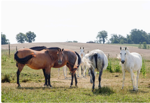
Juments futures mères