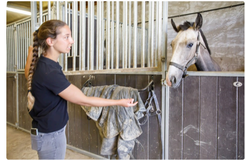
Dans l'écurie des juments