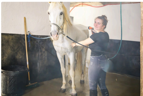
Une douche appréciée