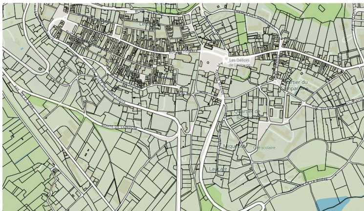
La complexité des procédures administratives : l'argent des contribuables utilisé à perte ?

Des difficiles relations avec les services de l'état ! Mais surtout des règles plus qu'obscures pour le citoyen lambda !