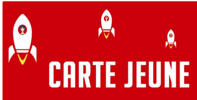
Préparez la rentrée avec la Carte Jeune Occitanie