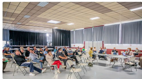
2 Le conseil CCAA dans la halle à Riscle 1bis 150620.jpg

Néanmoins, certains regrettent que, au minimum, le site Internet de l'ancien OT d'Aignan n'existe plus : on n'a plus le calendrier des divers événements et manifestations.