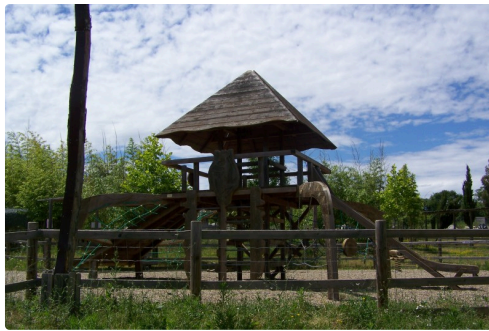
Aire de jeux