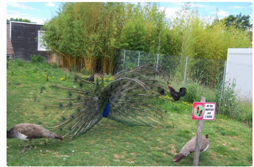
Fin de la visite, on est salué par une magnifique roue