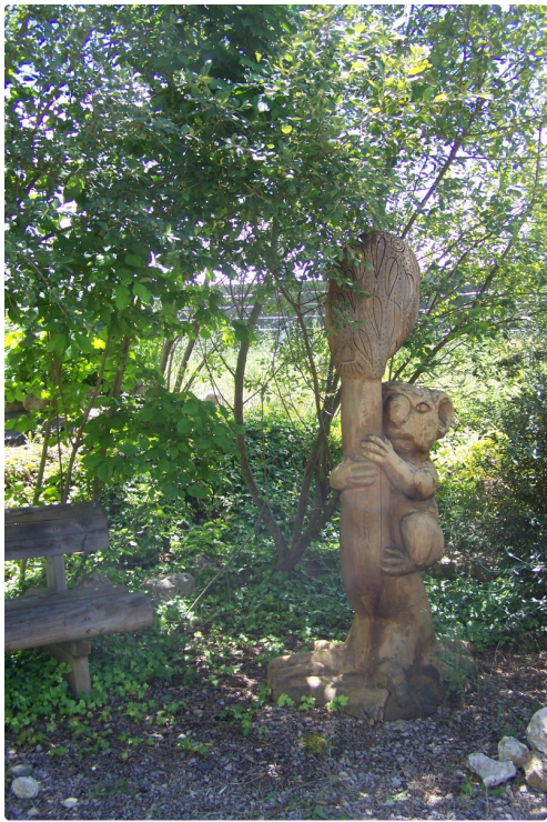
Un koala en déco