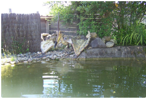
Une représentation d'un ptéranodon