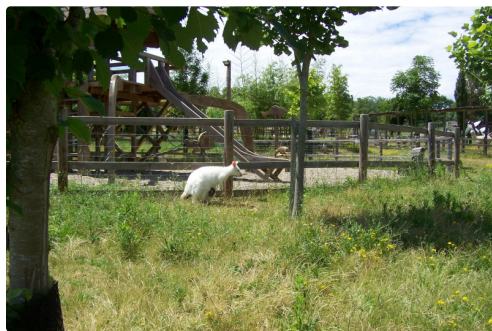
Pas facile d'être proche, mais on le voit quand même