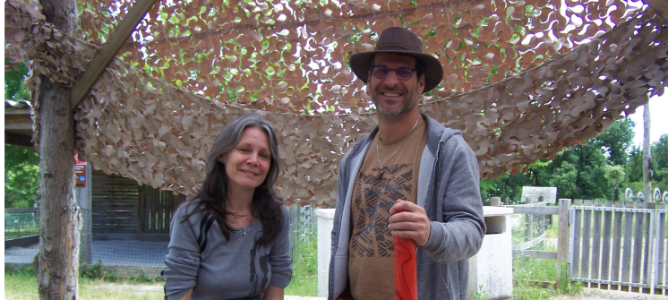
Le Vallon des kangourous : de l'exotisme à découvrir en famille