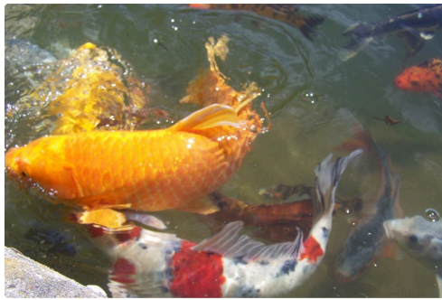
Les carpes en évolution