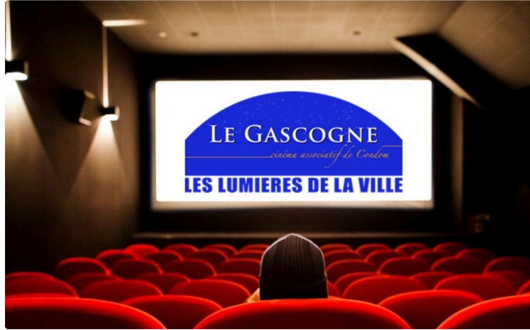
Les lumières de la ville vont à nouveau éclairer Le Gascogne !

Après trois mois sans programmation, l'écran du cinéma condomois va s'animer à nouveau