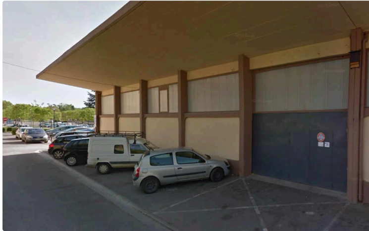
Halle Eloi Castaing : un deuxième bureau de vote y sera installé

Dimanche 28 juin aura lieu le second tour des élections municipales. Les mesures sanitaires mises en place pour accueillir les électeurs nécessitent certains aménagements, et notamment un déplacement du bureau de vote n°5.