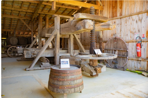
Enorme presseur à taissans du XVIIe siècle