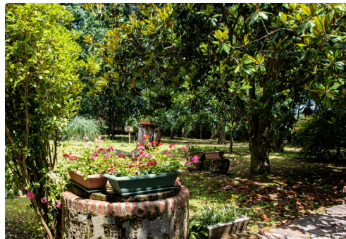
Le vaste parc ombragé de la maison Lacaze