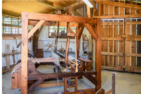
Métier à tisser du XVIIe siècle (en fonctionnement)