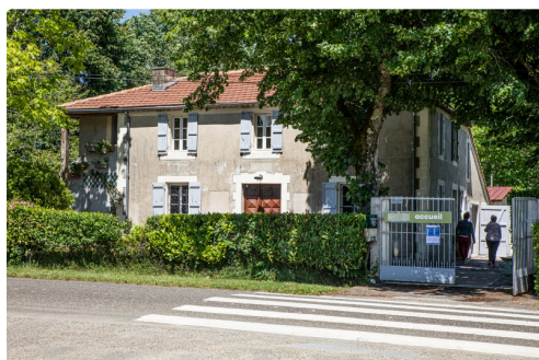
L'accueil se fait à la maison Bernadette lacaze

En revanche, les Journées européennes du patrimoine, les samedi 19 et dimanche 20 septembre 2020 sont programmées pour de bon. Il y aura des apiculteurs pour commenter l'exposition en place dans la maison Lacaze.