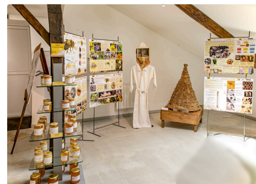
L'exposition sur l'apiculture et les ruches d'autrefois et de maintenant