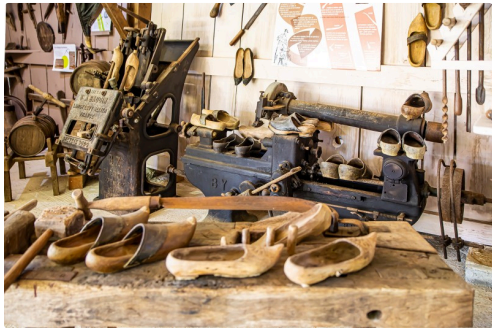
Atelier du sabotier