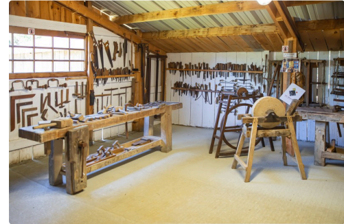
Menuiserie complète datant de 1830