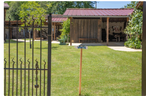
Entrée vers les collections de l'autre côté de la route