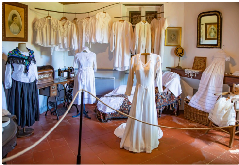
La lingerie ancienne