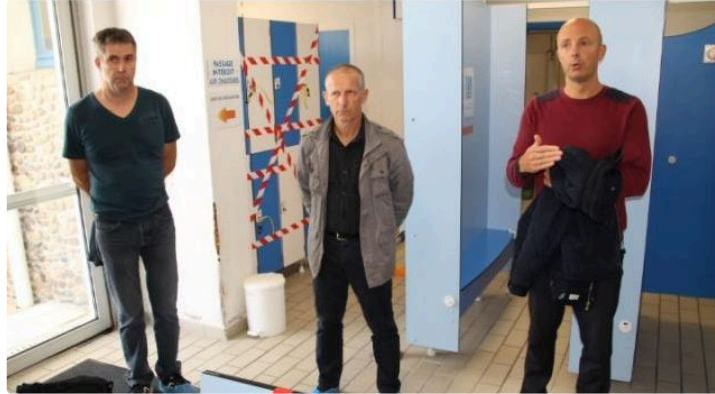
Réouverture de la piscine, le 15 juin

A partir du lundi 15 juin, la piscine de Grand Auch Cœur de Gascogne pourra de nouveau accueillir les nageurs qui devront respecter de nouvelles mesures sanitaires, conformément aux recommandations de l'État et de l'Agence Régionale de Santé (ARS).