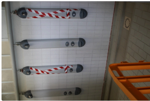
1 douche sur 2 en service