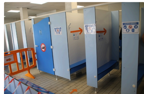
Circulation à sens unique