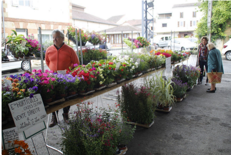
Le marché hebdomadaire s'étoffe

Voilà le deuxième marché qui se déroule sous la halle des Barris. Avec les commerçants venant à Miélan déjà tous les jeudis, aujourd'hui trois nouveaux étals sont présents.