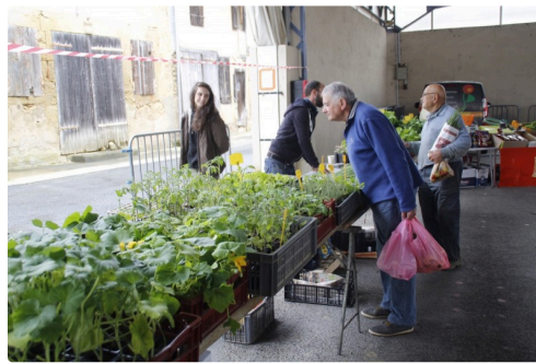
Mr et Mme Vignolo pour des plants de légumes