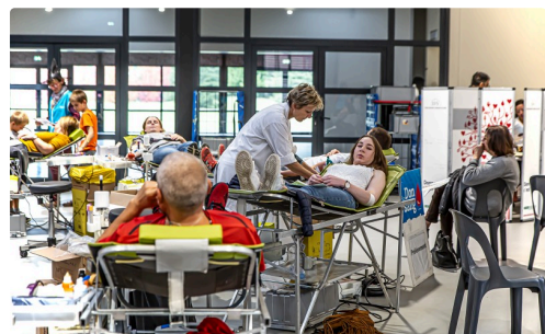
Don du sang à Nogaro en octobre 2019

N.B. - Les dons de sang sont possibles toutes les huit semaines : les personnes ayant donné au début du confinement peuvent dès à présent revenir en collecte ! Voir sur le site de l'EFS les contre-indications au don du sang ( https://dondesang.efs.sante.fr/qui-peut-donner-les-contre-indications/tout-savoir-sur-les-contre-indications )