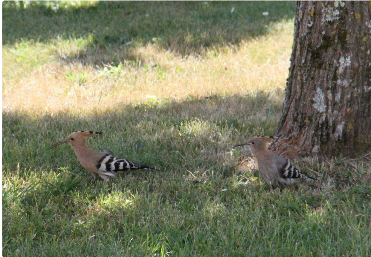
En ce moment, vous ne pouvez pas passer à côté

.. sauf si vous habitez avenue d'Alsace, à Auch, ou Rue Gambetta, à Condom