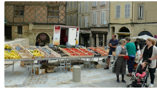
Fruits et légumes en "plein-vent".