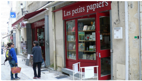
La librairie Les petits papiers : une ouverture qui était fort attendue.