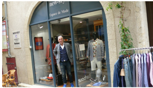
New-Styl, espace de mode : les bonnes habitudes se mettent en place.