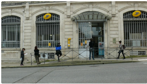
Distanciation bien respectée avant d'entrer à la Poste.