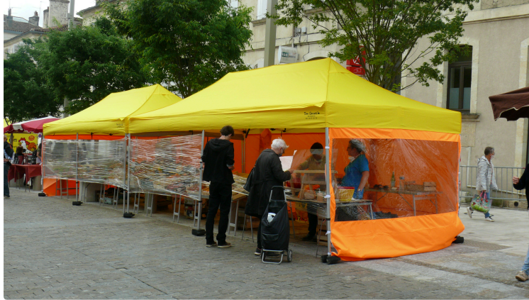
Le piéton se paie une balade en plein déconfinement

Ce samedi matin 6 juin, jour de marché de plein-vent, le piéton a flâné dans la haute ville, histoire de humer un bon coup ce déconfinement tant attendu. Une balade où son œil a remarqué certaines disparités dans ce que l'on appelle la distanciation.