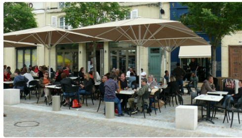
Les consommateurs se tiennent à une bonne distance.