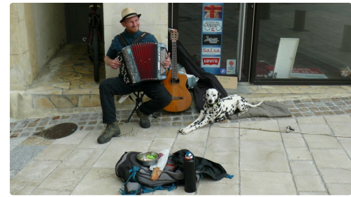
Un petit air d'accordéon, ce samedi, jour de marché.