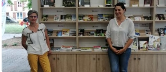
La randonnée de la semaine proposée par l'Office de Tourisme : Randoland à Vic-Fezensac