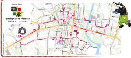
Fiche pour les plus de 10 ans

Tu disposes du plan ci-dessous. À l'emplacement des points rouges, lis les indications qui te permettront de résoudre l'énigme principale. À la fin de ta balade, rends-toi à l'Office de Tourisme ou visite le site www.randoland.fr pour vérifier ta réponse.