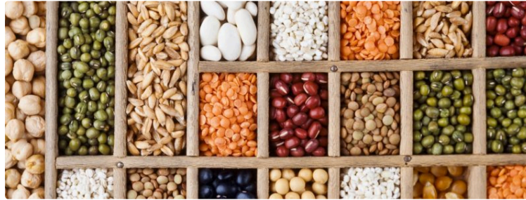
La grainothèque sort du confinement

À l'instar de la médiathèque de Pavié qui propose un drive pour récupérer livres et CD pour les abonnés, la grainothèque propose également de pouvoir récupérer ou déposer des graines en mode drive, en toute sécurité et dans le respect des gestes barrières.