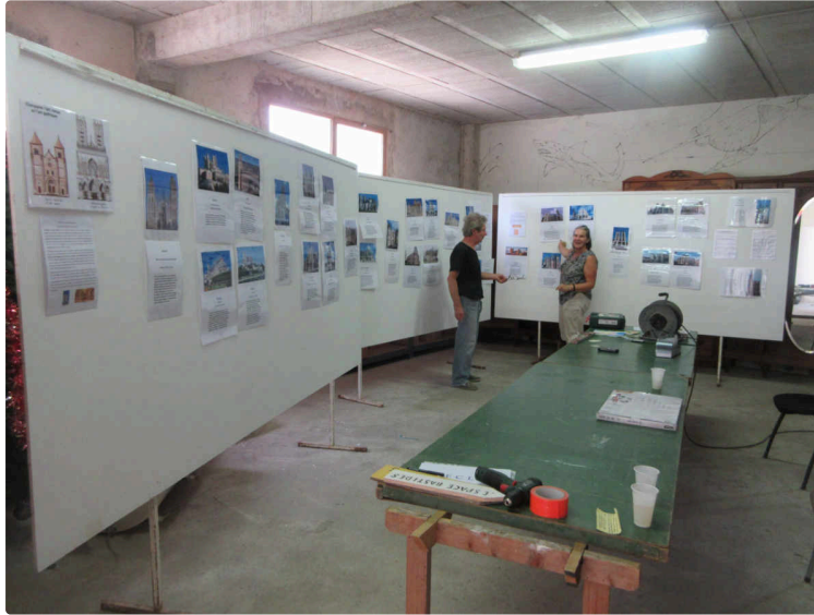
Des nouvelles du Club des Motivés

Ils préparent de quoi attirer les visiteurs dans la bastide