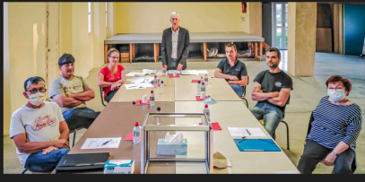
Le nouveau conseil municipal