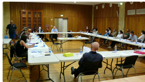
Les conseillers municipaux installés dans la salle Bernard IV.