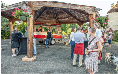
Les conseillers municipaux et des habitants se restaurent avant la séance