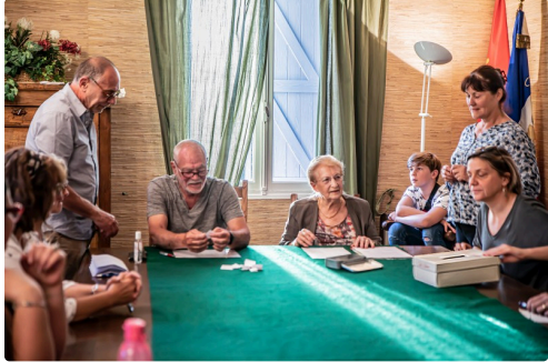
Dépouillement des bulletins de l'élection du maire