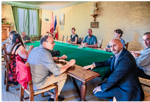
Les conseillers s'installent