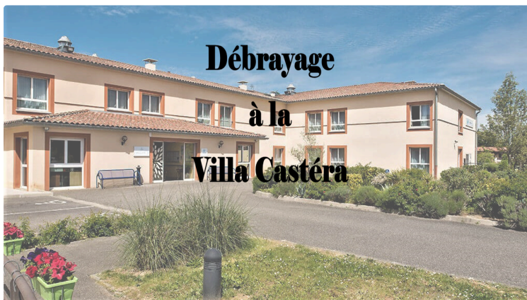
Débrayage revendicatif à l'EHPAD de Castéra-Verduzan

Comme prévu dans tous les EHPAD Korian de France, un débrayage d'une heure a eu lieu, cet après-midi, à l'appel de FO, de la CGT et Sud. Le groupe Korian gère 364 établissements (deux dans le Gers, la Villa Castéra, à Castéra-Verduzan, et Le Clos d'Armaganç, à Cazaubon) et emploie quelques 20.000 personnes.