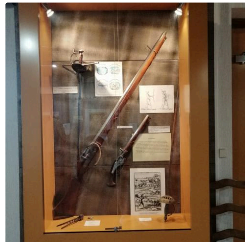
Les armes de d'Artagnan