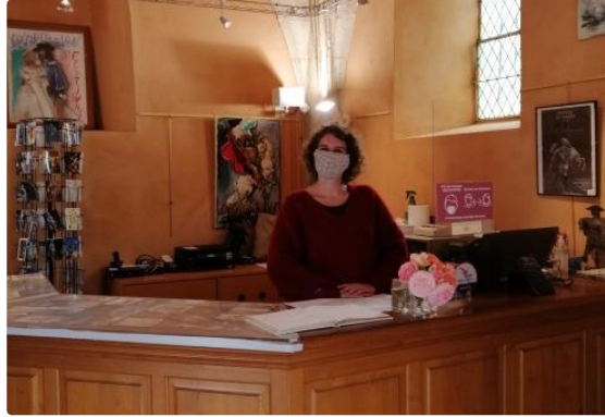
Du côté de Lupiac : le musée d'Artagnan a rouvert ses portes