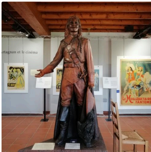
Statue en bois de d'Artagnan