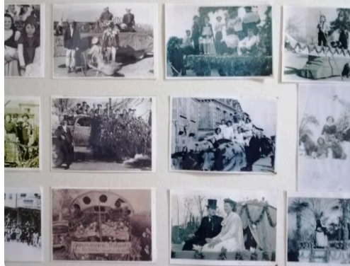
Lupiac autrefois à l'église