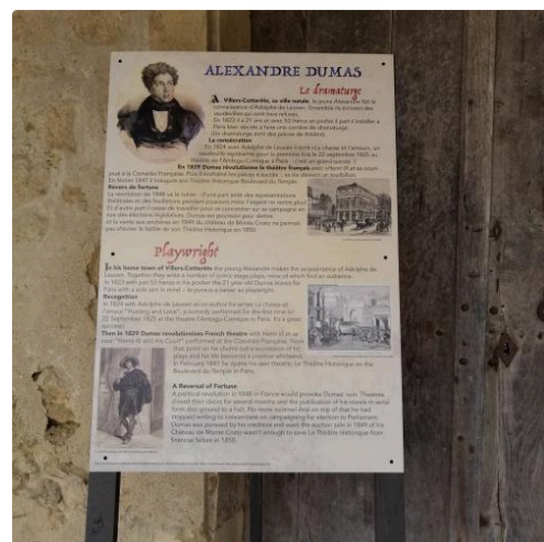
Exposition Alexandre Dumas