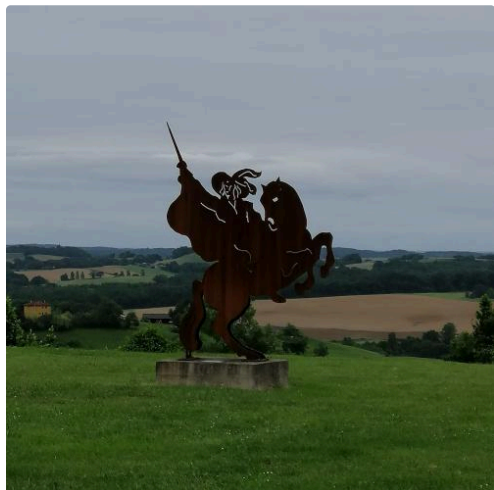
En entrant au musée...