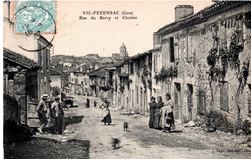
Quartier du Barry