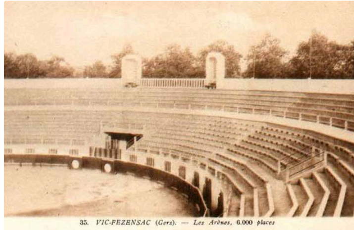
Vic, ville d'accueil et de résistance (suite)