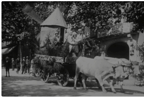
Défilé de chars