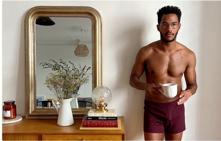
Pétronne emballe les hommes

La marque chic de sous-vêtements étoffe son offre