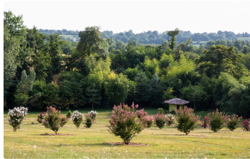
... et en août