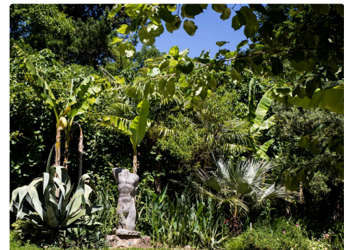
Statue de Wolfgang Holz dans son écrin de vert