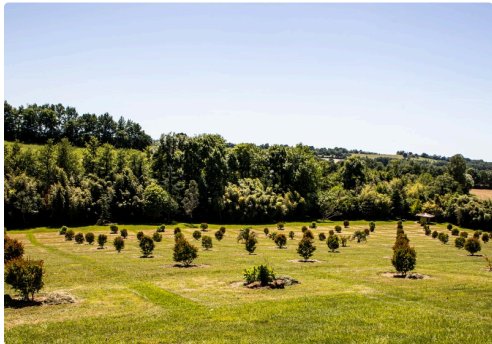
La mosaïque de lagerstroemias sans fleurs...