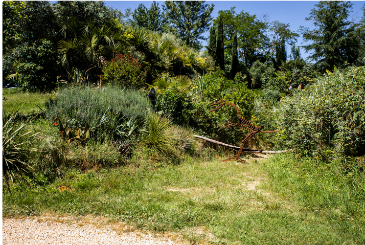
2e promenade dans la Palmeraie enchantée de Bétous

La nature exotique et gersoise parfaitement alliées