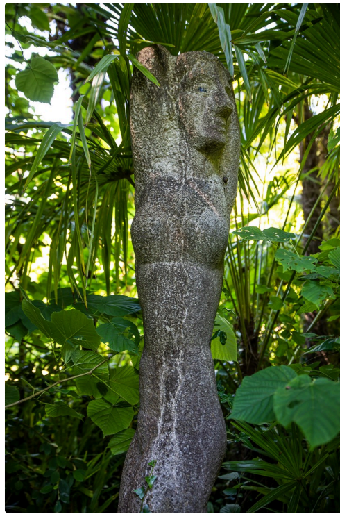
Daphné (du sculpteur Wolfgang Holz), nymphe poursuivie par Apollon et métamorphosée en laurier par Junon