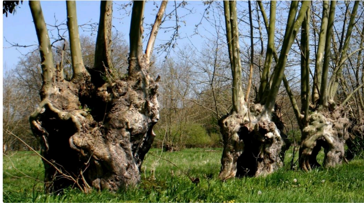
Les trognes, des arbres d'avenir.

Il faut renouer avec les trognes ! Ce ne sont en aucun cas des arbres du passé.