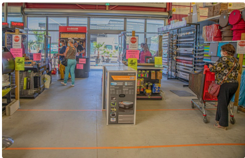
La sortie vers les 2 caisses