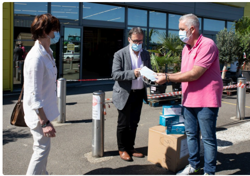
Il montre une boîte de 50 masques