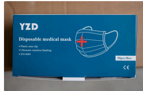
Gros plan sur une de ces boîtes